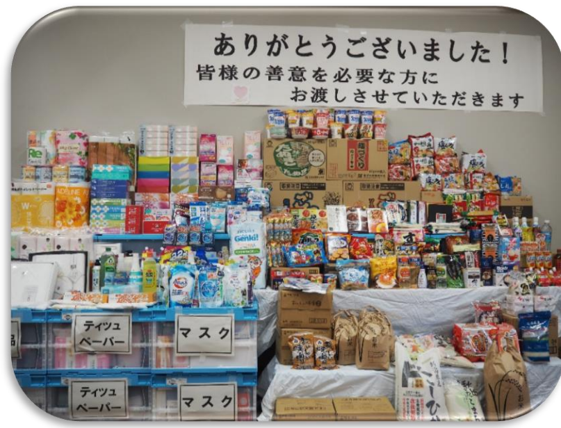
写真はご寄付をいただいた一部です

ご寄付いただいた食品や生活用品は、子ども支援や生活支援に関わるNPO法人などを通じ、必要とする方々にお渡しさせていただきました。皆様のご協力に心より感謝申し上げます。令和7年度も実施してまいりますのでご協力のほど、よろしくお祈りいたします。