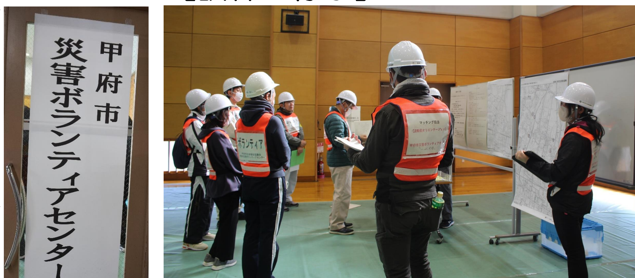
【活動前オリエンテーション】