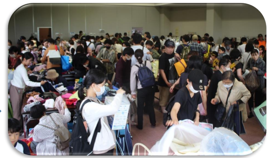
会場：健康の杜センター アネシス