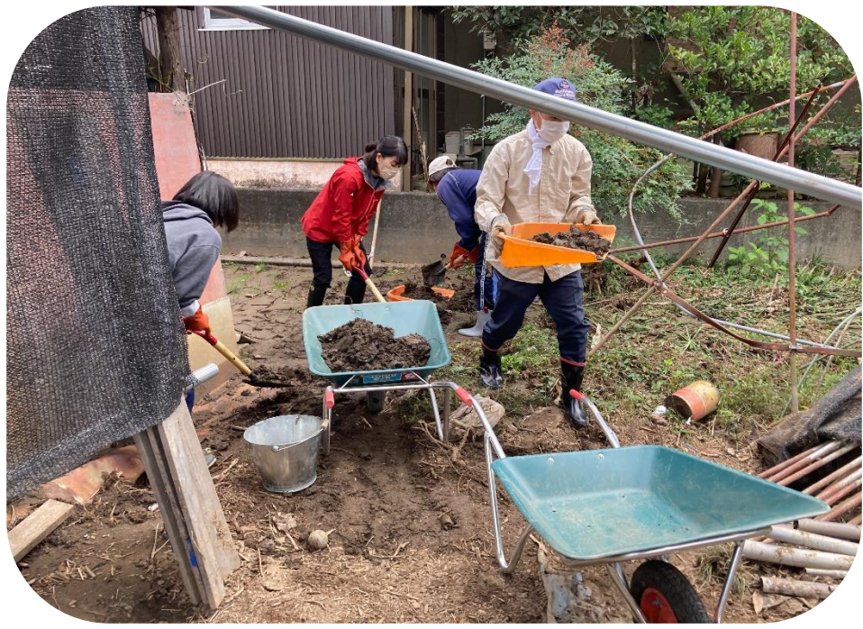
実際の活動の様子

※登録対象者や活動内容・登録方法など、詳しくは、甲府市社会福祉協議会ホームページをご覧ください。