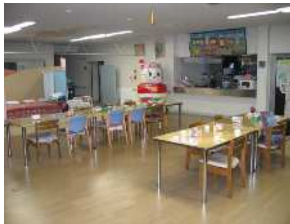
デイサービスセンター